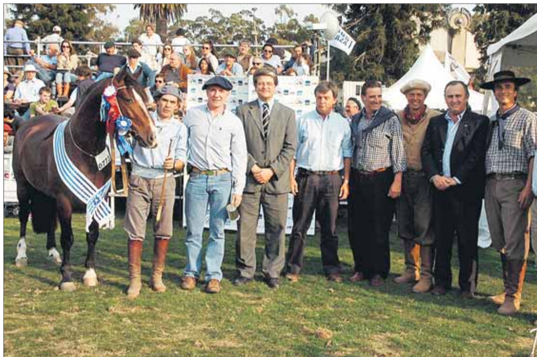
Campeón. “Jagüel Ídolo”, de cabaña “Septiembre” de Green Belt SA fue el mejor Reproductor.

Freno de Oro. Hoy se realizan las pruebas de Campo y Manguera; mañana se definirá