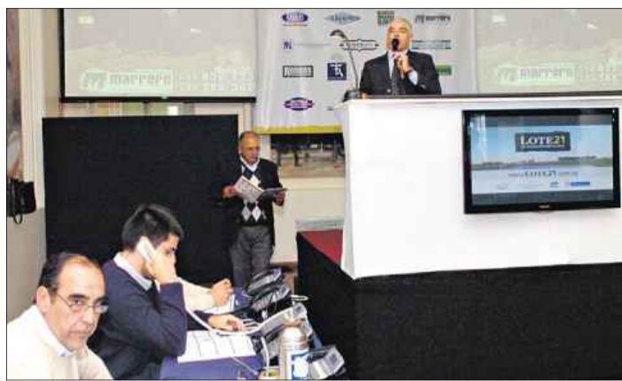
En Maroñas. Como siempre administró el Banco Comercial.