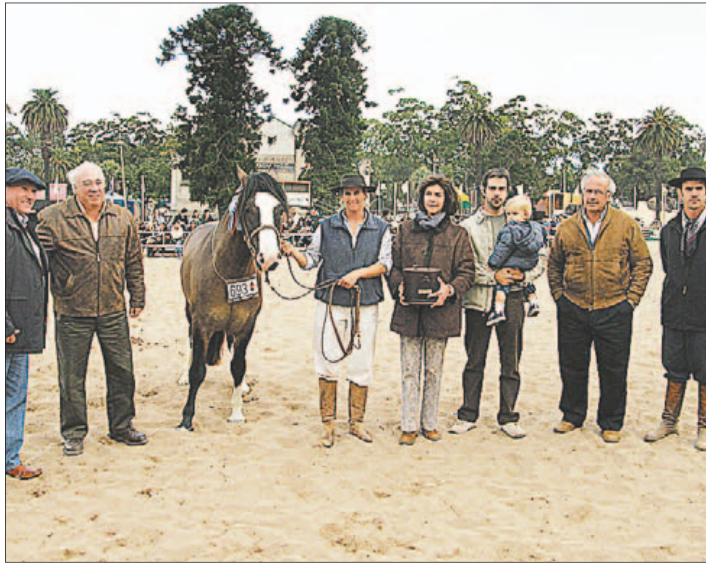
Grandes Campeones. De "La Quebrada" de Aznárez Elorza Hnos. en machos y de "Septiembre" de Green Belt SA en hembras.

Ganadores. De cabañas "La Quebrada" y "Septiembre"