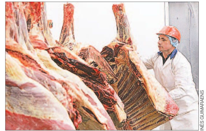
Cortes. El ritmo de embarques cayó en los últimos meses.

Ante la caída del ritmo de los embarques desde Uruguay, los importadores mexicanos incrementaron sus compras de carne estadounidense para abastecer sus necesidades. La esperanza del gobierno está centrada en la visita que realizará, el mes que viene, el presidente de la República, Tabaré Vázquez para reunirse con su colega Felipe Calderón. Uruguay también busca ampliar el ingreso de quesos sin arancel.